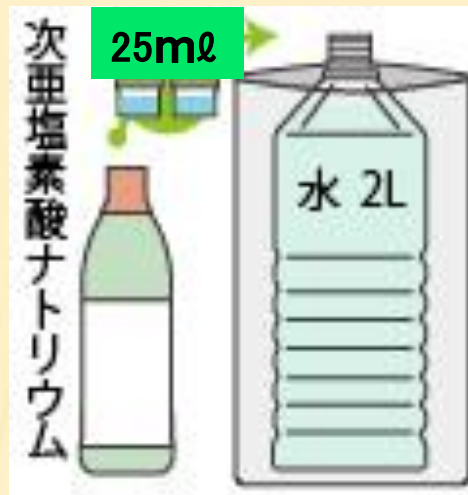
②同梱の次亜（原液）を希釈