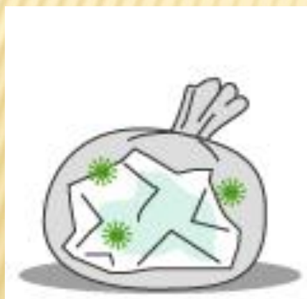
④同梱の袋へすべて破棄