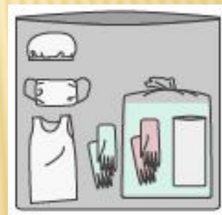
⑥全てをポリ袋へ廃棄