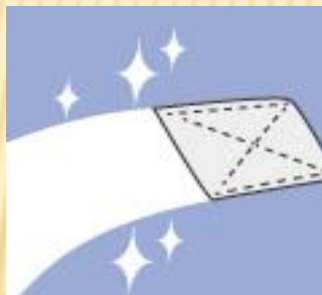
⑤床を次亜を含ませたペーパーで処理