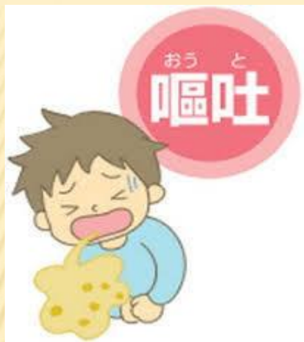
①何らかの原因で嘔吐